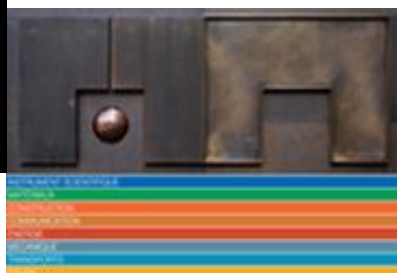
L'entrée du Musée des Arts et

Découvrez le Musée : L'exposition permanente offre un parcours dans l'histoire et l'actualité des techniques. Vous y trouverez les sept domaines du musée : Instrument Scientifique, Matériaux, Construction, Communication, Énergie, Mécanique et Transports. A travers une sélection, découvrez de manière chronologique quelques-uns des plus beaux objets du musée.